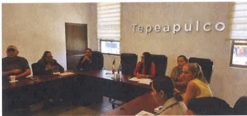
SESION DE COMISION DE HACIENDA