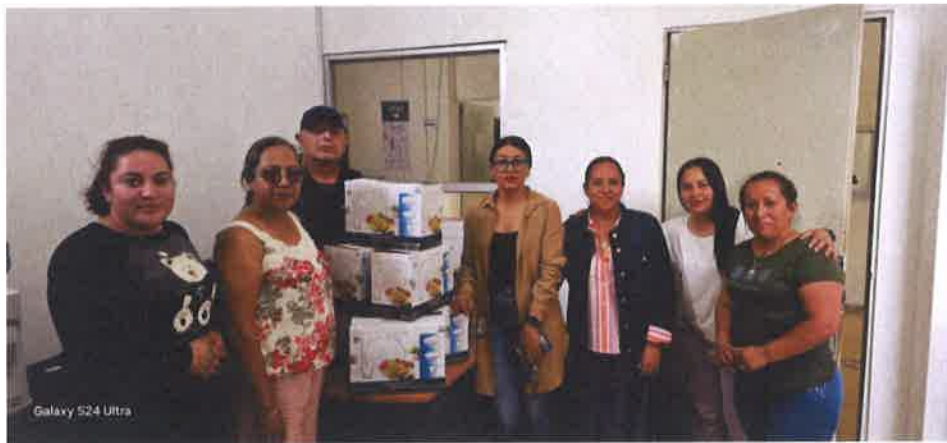
APOYO A CIUDADANOS EVENTO 10 DE MAYO