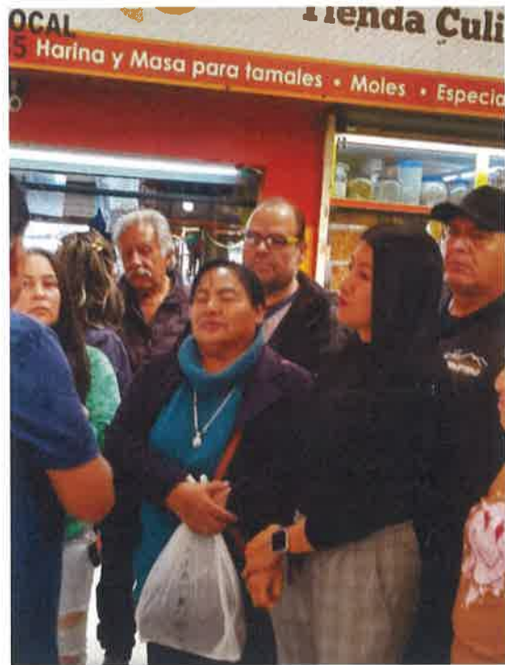
ATENCION A COMERCIANTES