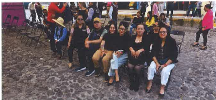
INAUGURACION DE LA TELEMEDICINA