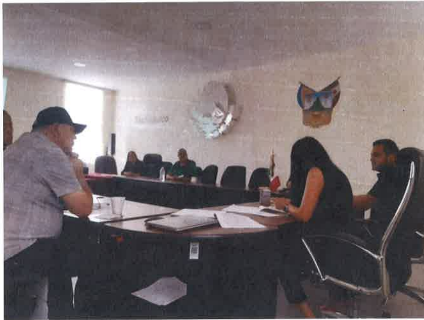
SESION COMISION DE HACIENDA