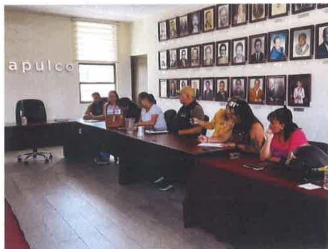
MESA DE TRABAJO CON VECINOS COL. CARROS