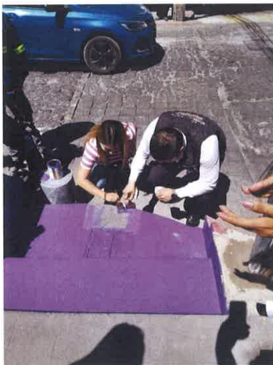
SEÑALAMIENTO PARADA VIOLETA