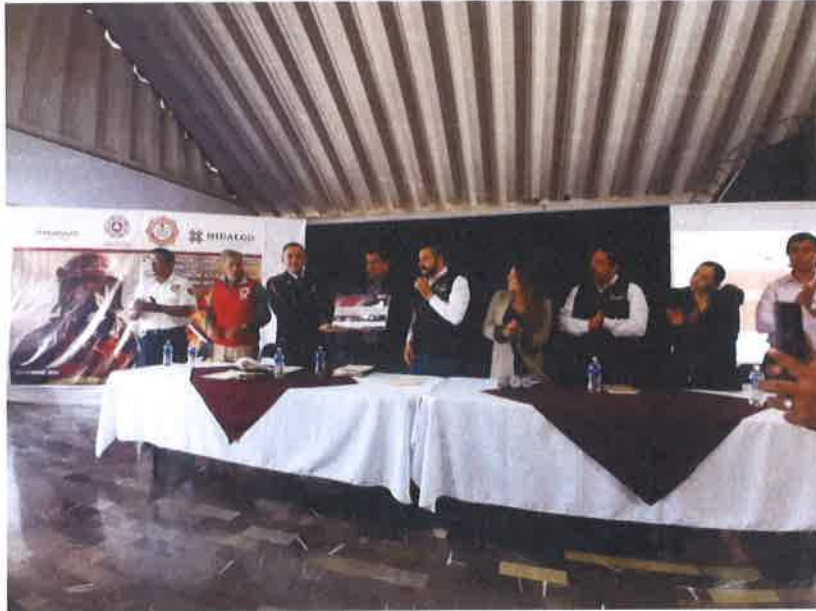
PRESENTACION ATLAS DE RIESGO