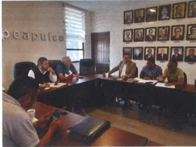
INGENIEROS DE LA COOPERATIVA LF DEL CENTRO