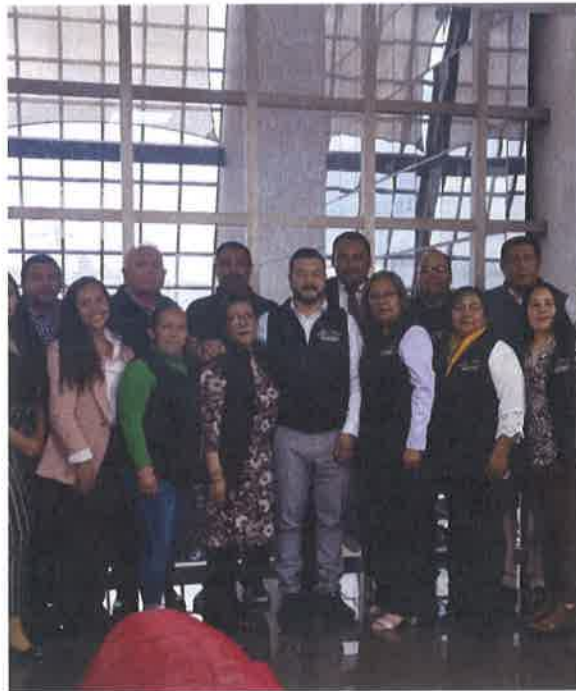
CURSO DE CAPACITACION CONGRESO DEL ESTADO