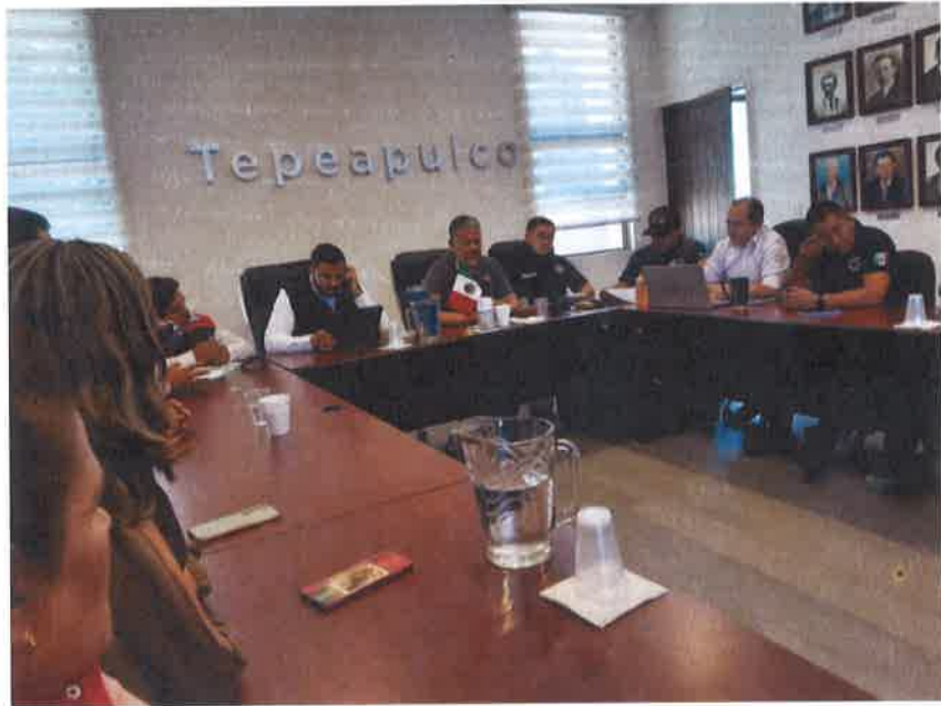
SESION DE PROTECCION CIVIL