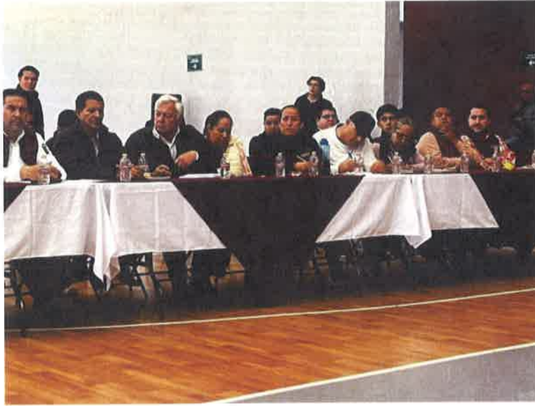
SESION DEL COMITÉ PARA EL DESARROLLO MUNICIPAL