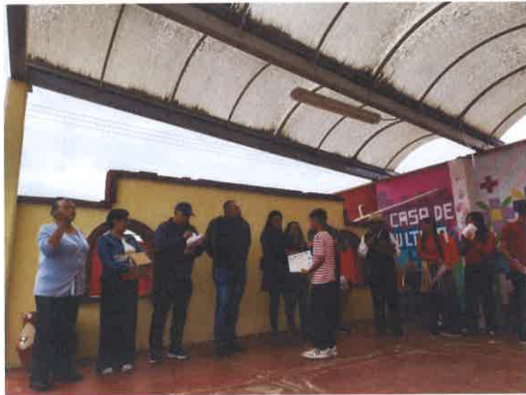
CLAUSURA CURSO DE VERANO CASA DE CULTURA