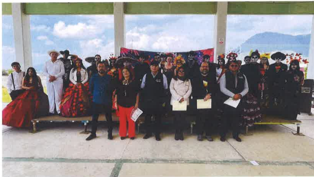
DIA DE MUERTOS COBAEH