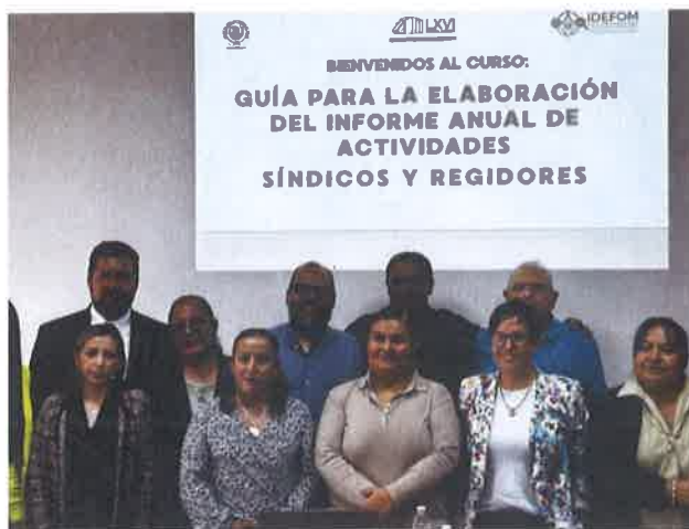
CURSO EN EL CONGRESO DEL ESTADO