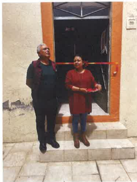
EXPOSICION DE MONEDAS ANTIGUAS