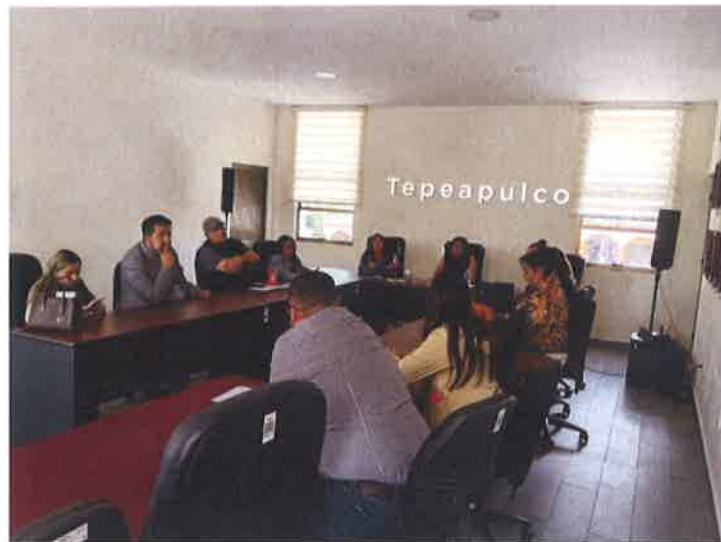
SESION DE LA COMISION DE HACIENDA