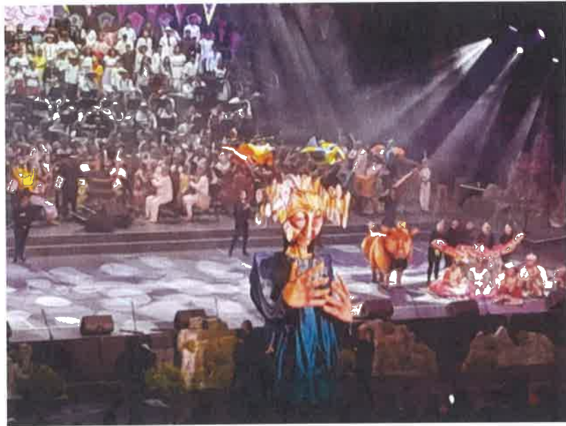
SEMILLEROS CREATIVOS AUDITORIO NACIONAL