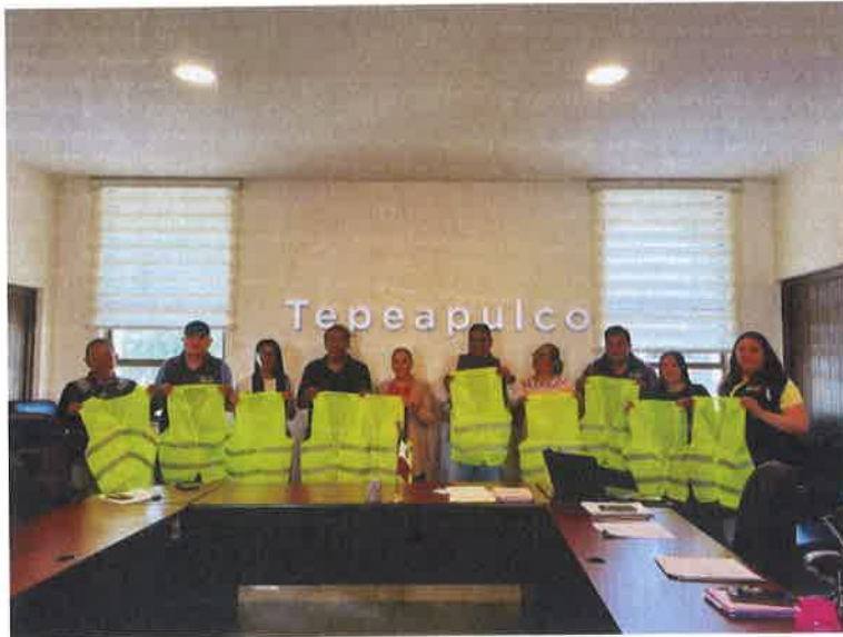
ENTREGA DE CHALECOS PERSONAL DE MERCADOS