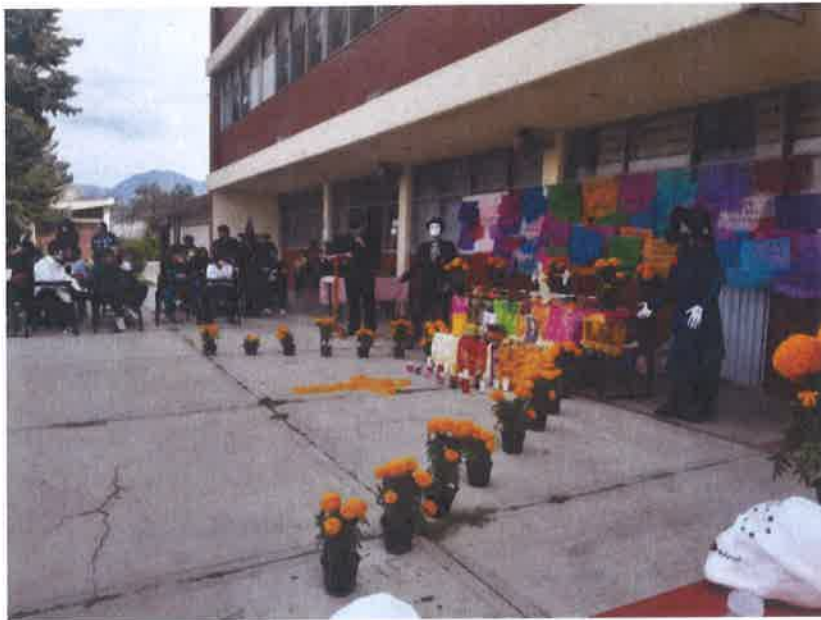
DIA DE MUERTOS TELESECUNDARIA NO. 12