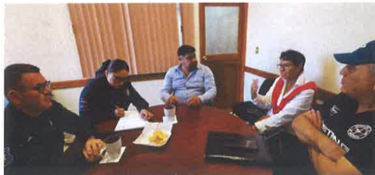
MESA DE TRABAJO CON EL SECRETARIO DE SEGURIDAD PUBLICA