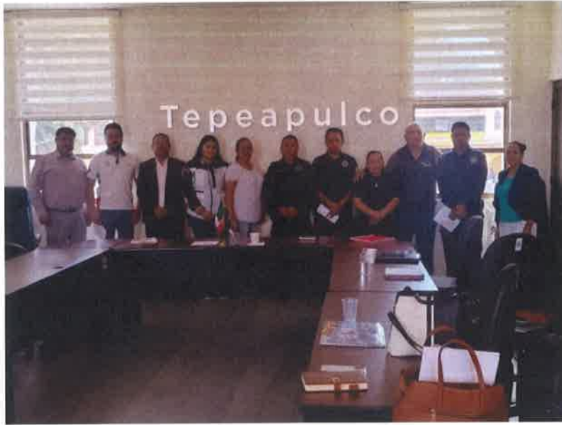
SESION DE COMISION DE HONOR Y JUSTICIA