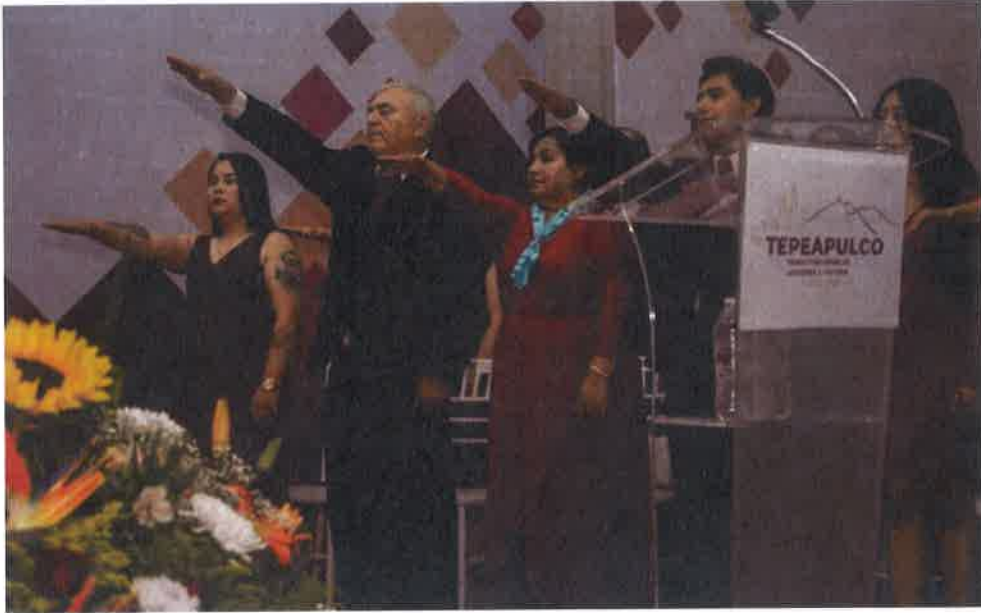
TOMA DE PROTESTA