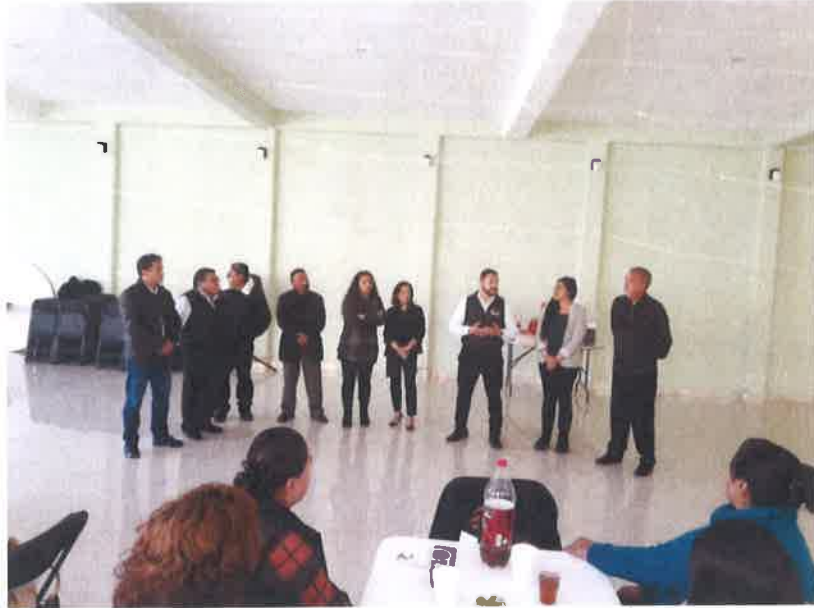
EVENTO DE SINDICALIZADOS