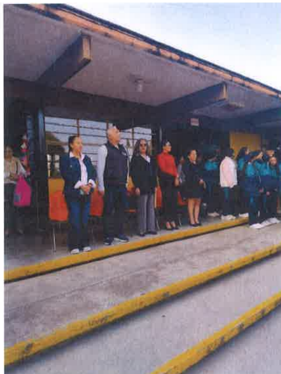
ACTO CIVICO SECUNDARIA NO. 26