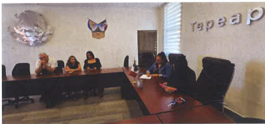
MESA DE TRABAJO COMISION DEL DEPORTE