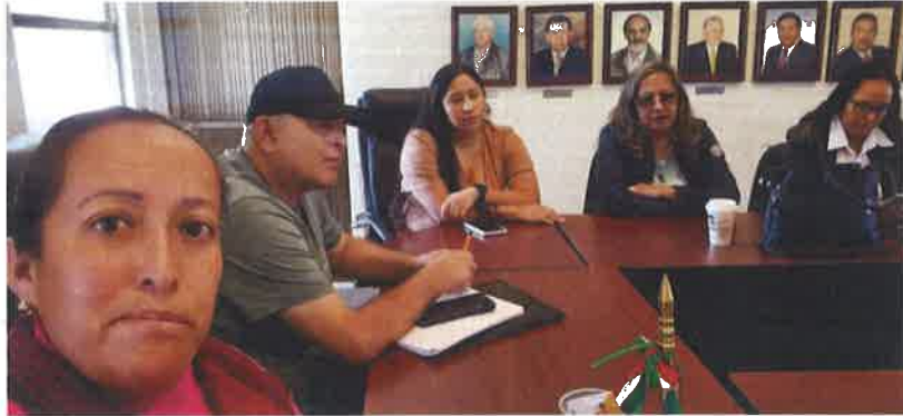
MESA DE TRABAJO CON LA JURIDICO DE LA SRIA. DE SEG. PUB. MUNICIPAL