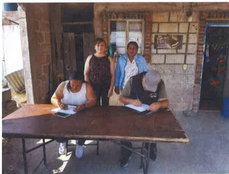
AFILIACION PARA LA CLINICA TEPEA-BIENESTAR