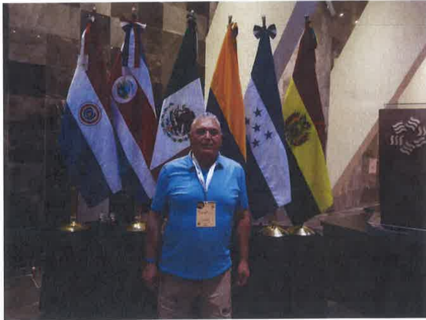
CONGRESO INTERNACIONAL REGIDORES Y CONSEJALES