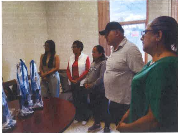
APOYO DE TROFEOS PARA EVENTO DEPORTIVO COL. PINO SUAREZ