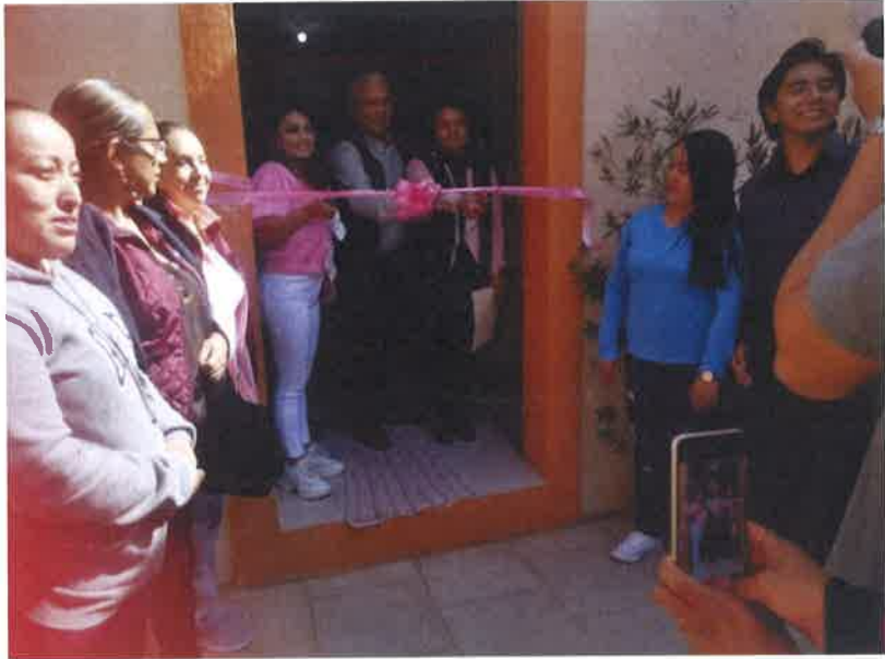
REAPERTURA DE LA BIBLIOTECA