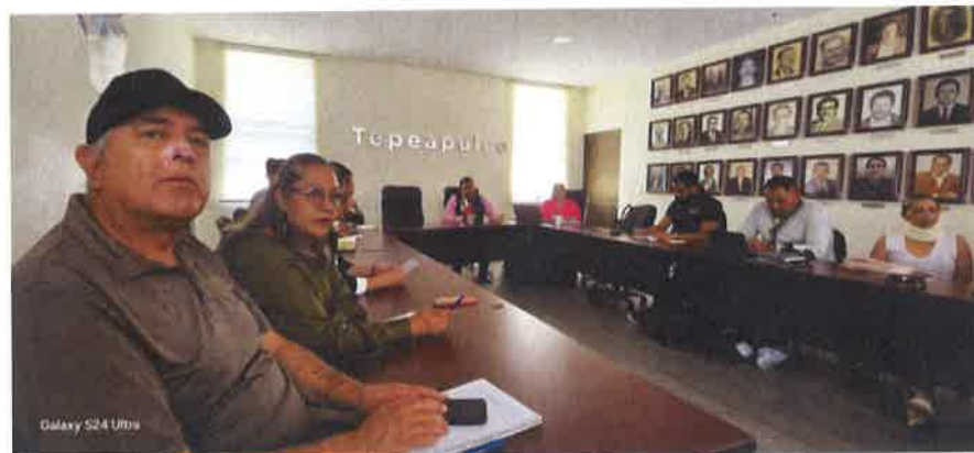
SESION DE ORGANIGRAMA