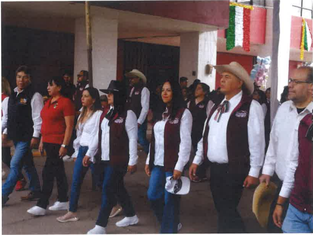
DESFILE 16 DE SEPTIEMBRE