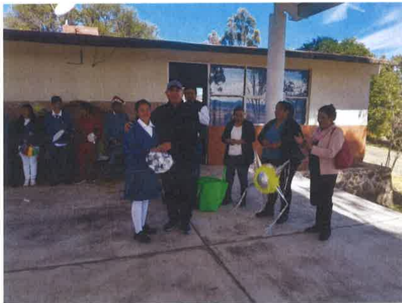
ENTREGA ARTICULOS DEPORTIVOS TELESECUNDARIA PALO HUECO