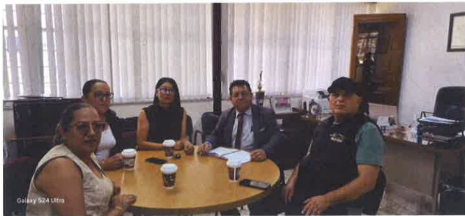
REUNION CON EL DIRECTOR DEL CBTIS NO. 159