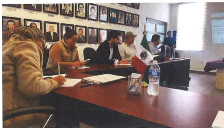
MESA DE TRABAJO DE MERCADOS