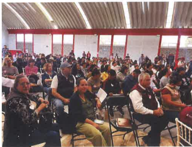
FORO REGIONAL SALUD Y BIENESTAR ANIMAL