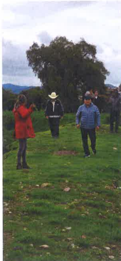
REUNION CON VECINOS COL. FRANCISCO I. MADERO