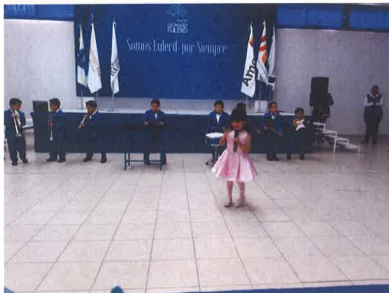
EVENTO CIVICO COLEGIO LEONARD EULERD