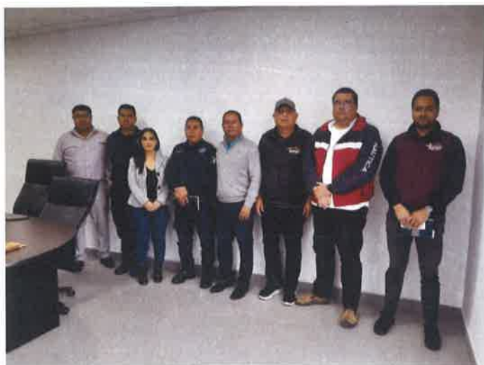
CURSO CAPACITACION SEGURIDAD PUBLICA DEL ESTADO